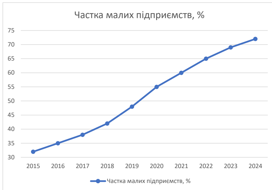
Рисунок 1 – Динаміка використання цифрових маркетингових інструментів підприємствами малого бізнесу

План діджитал-маркетингу вимагає зібрати різні онлайн-канали і інструменти в один план для компанії. Д. Райан каже, що хороший цифровий маркетинг працює, коли контент, канали і аналітика працюють разом. Це дає кращий результат і підвищує ефективність мар-