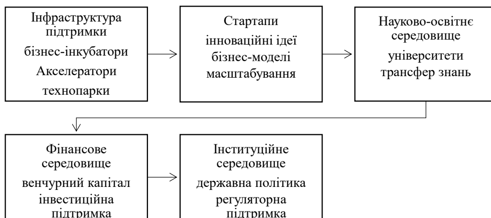
Рисунок 2 – Механізм підвищення ефективності інноваційної екосистеми та розвитку інфраструктури підтримки стартапів

Окремої уваги потребує вдосконалення фінансової складової інноваційної екосистеми. Інфраструктура підтримки підприємництва має сприяти розширенню доступу стартапів до різноманітних джерел фінансування, зокрема венчурного капіталу, корпоративних інвестицій і державних програм підтримки. Акселератори та технопарки можуть відігравати роль посередників між стартапами та інвесторами, знижуючи інформаційні бар'єри та підвищуючи інвестиційну привабливість інноваційних проєктів. В умовах цифрової трансформації економіки важливим завданням є інтеграція інфраструктури підтримки підприємництва у процеси впровадження цифрових технологій та інноваційних бізнес-моделей. Інкубатори й акселератори повинні стимулювати використання цифрових