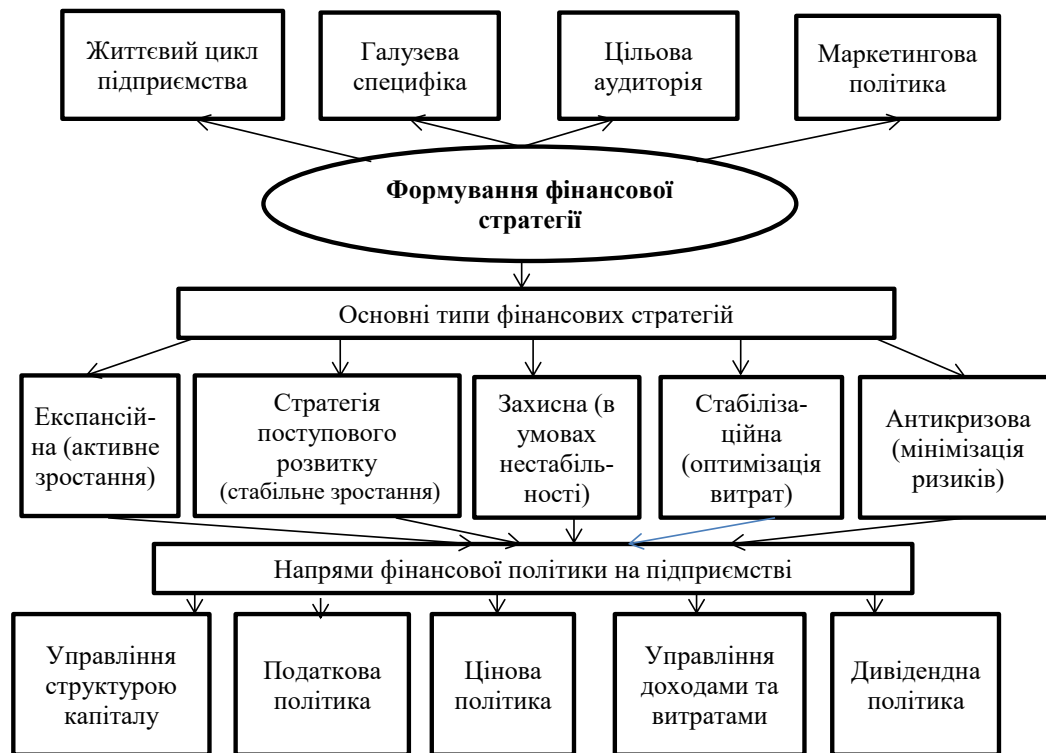
Рисунок 2 – Основні типи фінансових стратегій підприємства та напрями фінансової політики