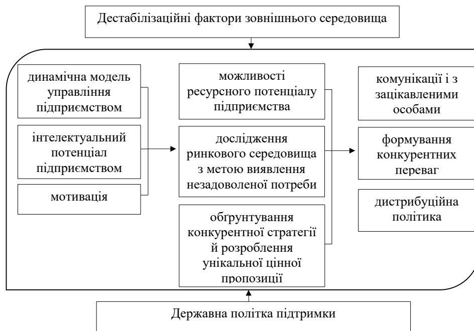
Рисунок 3 – Механізм формування конкурентної політики підприємств-надавачів житлово-комунальних послуг

До державної підтримки підприємств-надавачів житлово-комунальних послуг слід віднести відбудову