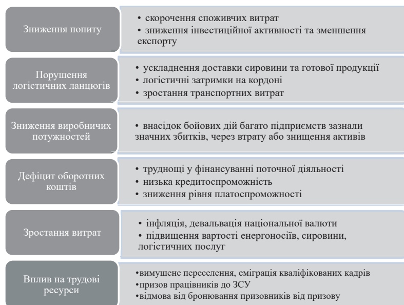
Рисунок 1 – Фактори впливу війни на фінансову стійкість підприємств

Війна в Україні створила безпрецедентні виклики для українського бізнесу, спричинивши значні втрати та порушення звичних бізнес-процесів. Через це постраждала і сама економіка країни, змусивши багато підприємств скорочувати діяльність або призупиняти роботу через руйнування інфраструктури, зростання витрат і дефіцит кадрів. Найважливіші чинники, які впливають на фінансову стійкість підприємств в умовах війни наведено на рис. 1.