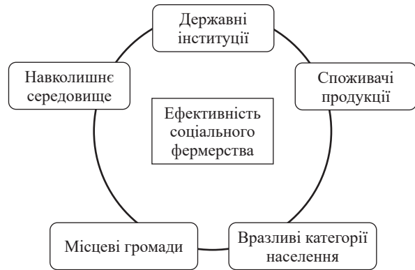
Рисунок 1 – Напрями прояву ефективності соціального фермерства

В умовах інтеграції сільського господарства України, роль соціального фермерства проявляється через корисність для різних суб'єктів та інституцій (рис. 1).