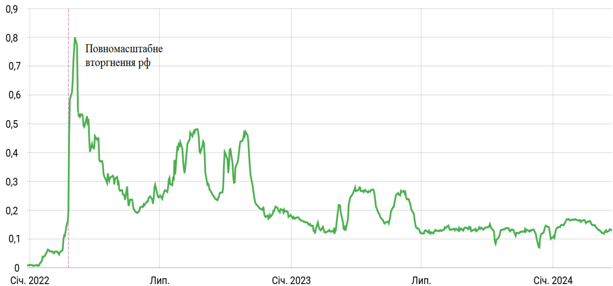
Рисунок 2 – Індекс фінансового стресу з початку повномасштабного вторгнення