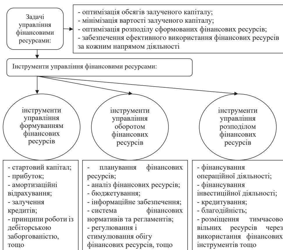
Рисунок 4 – Управління фінансовими ресурсами у розрізі груп інструментів (узагальнено авторами на базі