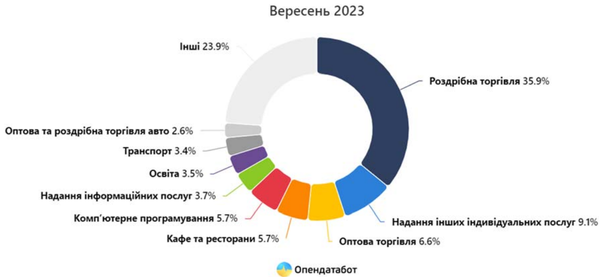
Рисунок 3 – Топ-сфер діяльності нововідкритих ФОПів