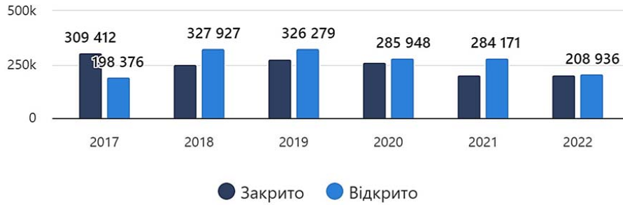
Рисунок 1 – Динаміка ФОПів в Україні