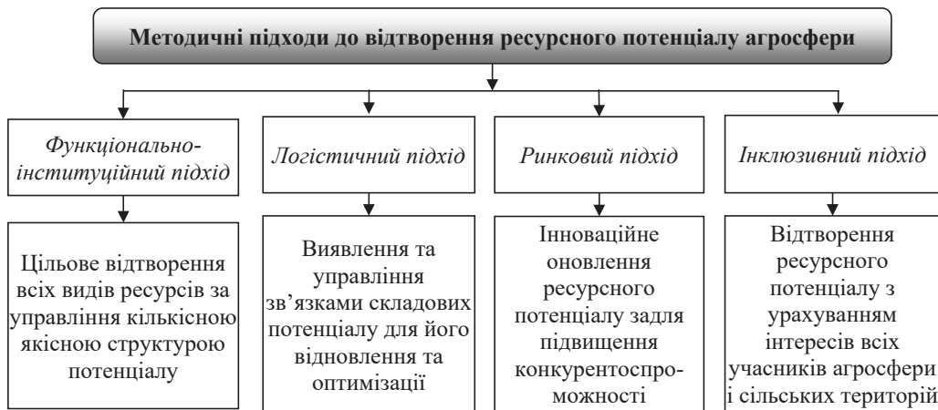
Рисунок 2 – Методичні підходи до відтворення ресурсного потенціалу аграрних бізнес-суб'єктів