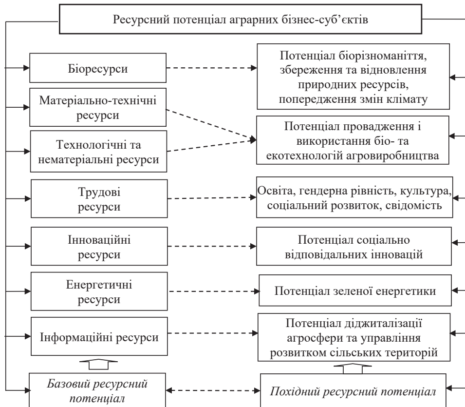
Рисунок 1 – Складові ресурсного потенціалу бізнес-суб'єктів за умов інклюзивних трансформацій агроекономіки

Результатом імплементації такого стратегічного концепту інклюзивного агроменеджменту має стати обґрунтування чіткого організаційно-економічного механізму відтворення ресурсного потенціалу, орієнтованого на досягнення спільного екологічного, соціального та економічного ефекту. Сукупним мультиплікаційним ефектом є підвищення рівня конкурен-