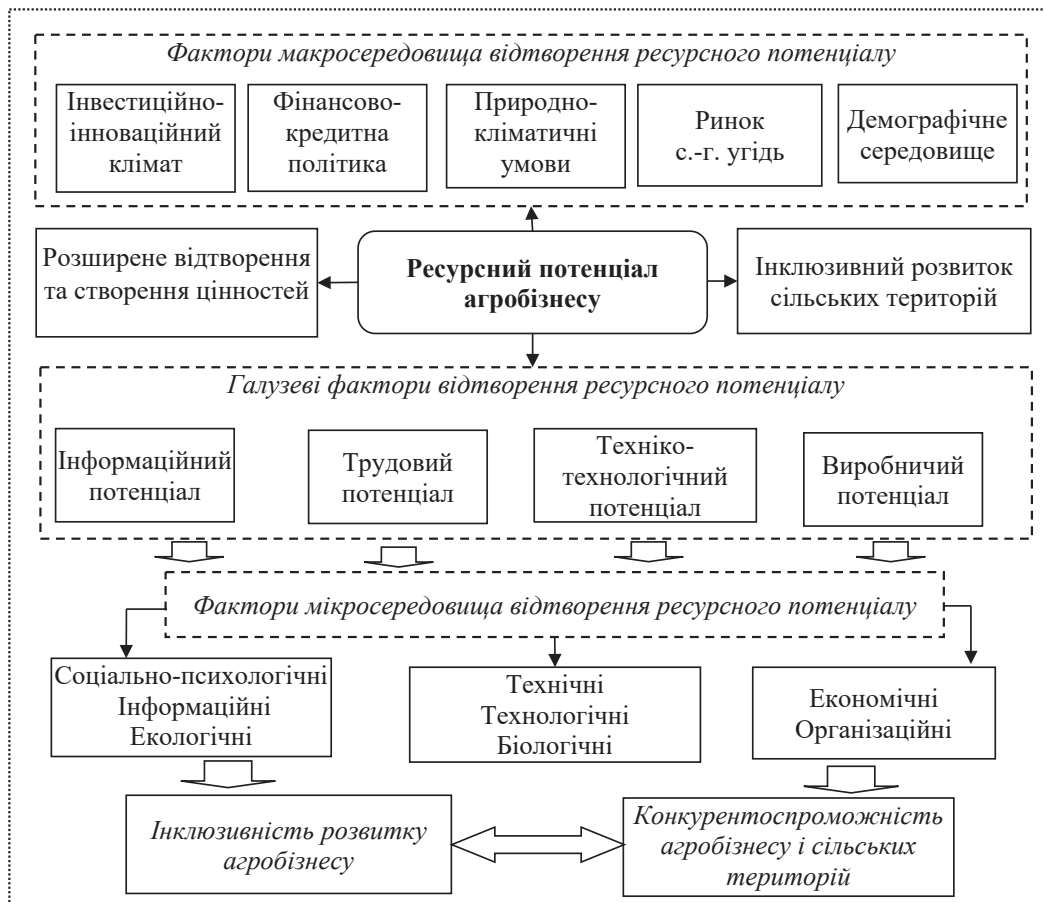
Рисунок 4 – Система факторів відтворення ресурсного потенціалу суб'єктів аграрного бізнесу

Висновки. Таким чином, відтворення виробничих ресурсів за умов розвитку інклюзивних процесів в агросфері формує додаткові можливості та потенціал агровиробництва, який може бути використаний на користь агробізнесу та сільських територій.