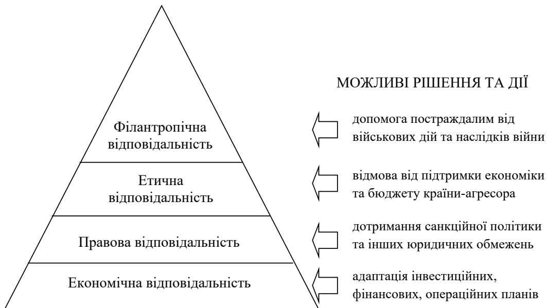
Рисунок 1 – Піраміда корпоративної соціальної відповідальності (за А. Кероллом): контекст російсько-української війни