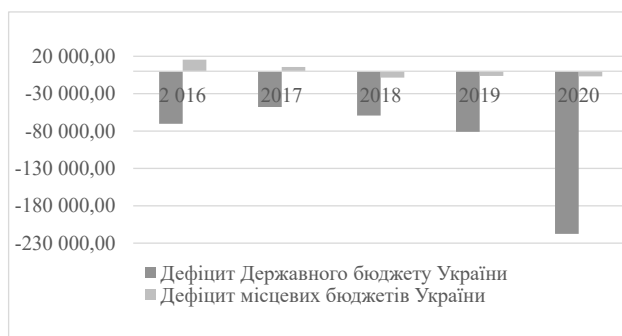
Рисунки 1 – Дефіцит Державного бюджету України та місцевих бюджетів України, млн грн [6]

Небажане зростання показників дефіциту Державного бюджету України та місцевих бюджетів України, державного боргу та інші проблеми виконання Державного та місцевих бюджетів України свідчать про те, що бюджетний процес потребує перегляду з метою подальшого удосконалення (рис. 1-2).