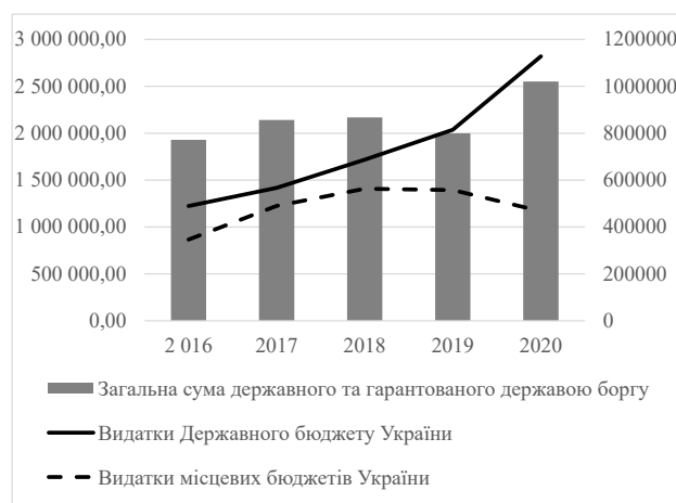
Рисунки 2 – Обсяги державного та гарантованого державою боргу та видатків Державного бюджету України та місцевих бюджетів України, млн грн [6]

Як бачимо з рис. 1 дефіцит Державного бюджету України упродовж 2016-2020 рр. зріс втричі: з 70,3 млрд грн до 217,6 млрд грн. Обсяг профіциту місцевих бюджетів став дефіцитним (з 15,4 млрд грн до -6,8 млрд грн). Сума державного та гарантованого державою боргу зросла на 30% (з 1929,8 млрд грн у 2016 р. до 2551,9 млрд грн у 2020 р.). Це пояснюється зростанням обсягів видатків Державного бюджету України на 130% (з 489,5 млрд грн у 2016 р. до 1127,9 млрд грн у 2020 р.) та місцевих бюджетів України на 35% (з 346,3 млрд грн у 2016 р. до 467,5 млрд грн у 2020 р.) (рис. 2).