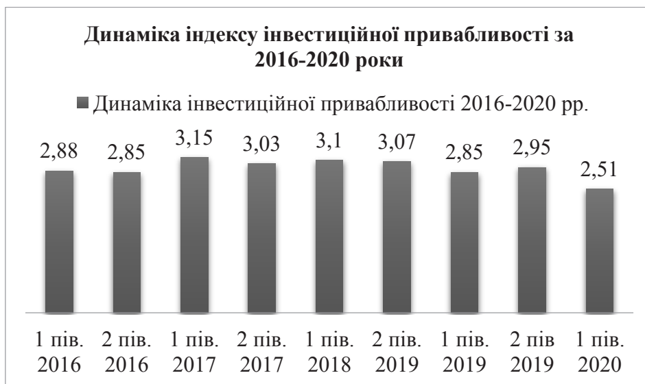
Рисунок 1 – Динаміка індексу інвестиційної привабливості України за 2016–2020 роки

До найбільших іноземних інвесторів України відносять Кіпр. Станом на 30 червня 2020 року компанії, зареєстровані в цій країні, інвестували в Україну понад