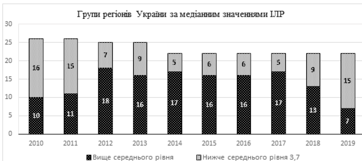
Рис. 1. Групи регіонів України за медіанним значеннями індексу людського розвитку у 2010–2019 роках

Результати проведеного аналізу дають підстави приєднуватись до підходів HDRO щодо необхідності переосмислення показників людського розвитку. Для цього доречно представити метрики людського розвитку та врахувати те, що HDR-2019 називав «розширеними можливостями» такі аспекти життя, як доступ до