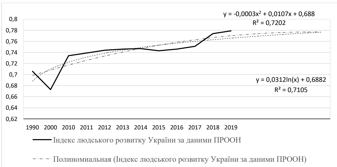
Рис. 2. Значення індексу людського розвитку в Україні за період 1990–2019 років за даними ПРООН

Нині загальний коефіцієнт України дорівнює 0,779 (з максимальних 1,000). Результати проведеного прогнозування вказують на високу ймовірність перспективного росту 71–72% за логарифмічною та поліноміальною формами трендів. При цьому, відповідно до індексу, очікувана тривалість життя в Україні становить 72,1 роки. Індекс освіти, який аналізує середню тривалість навчання громадян, становить 11,4 років, а очікувана тривалість навчання населення – 15,1 років. Натомість індекс валового національного доходу на душу населення становить 13 216 доларів США.