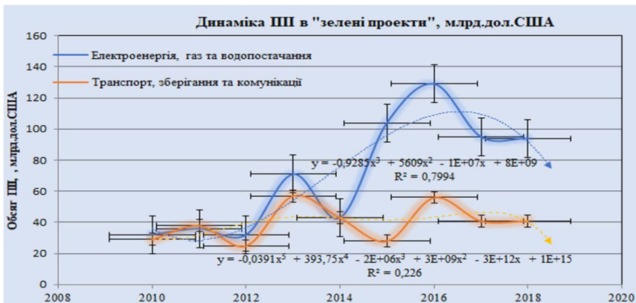
Рис. 1. Динаміка обсягу інвестицій ТНК у «зелені проекти» інфраструктури за 2010–2018 роки, млрд. дол. США