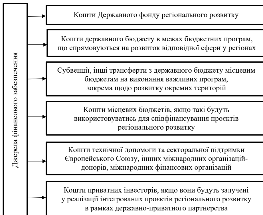
Рисунок 1 – Джерела фінансового забезпечення реалізації Державної стратегії регіонального розвитку на 2021–2027 рр.

У 2015 р. було ухвалено нормативно-правову базу відбору та реалізації проектів і визначено порядок використання коштів із Державного фонду регіонального розвитку. Це створило суттєві передумови