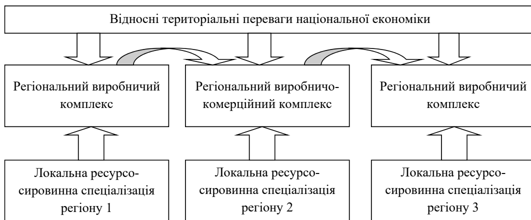
Рисунок 1 – Регіональні виробничі комплекси як основа формування територіальних конкурентних переваг