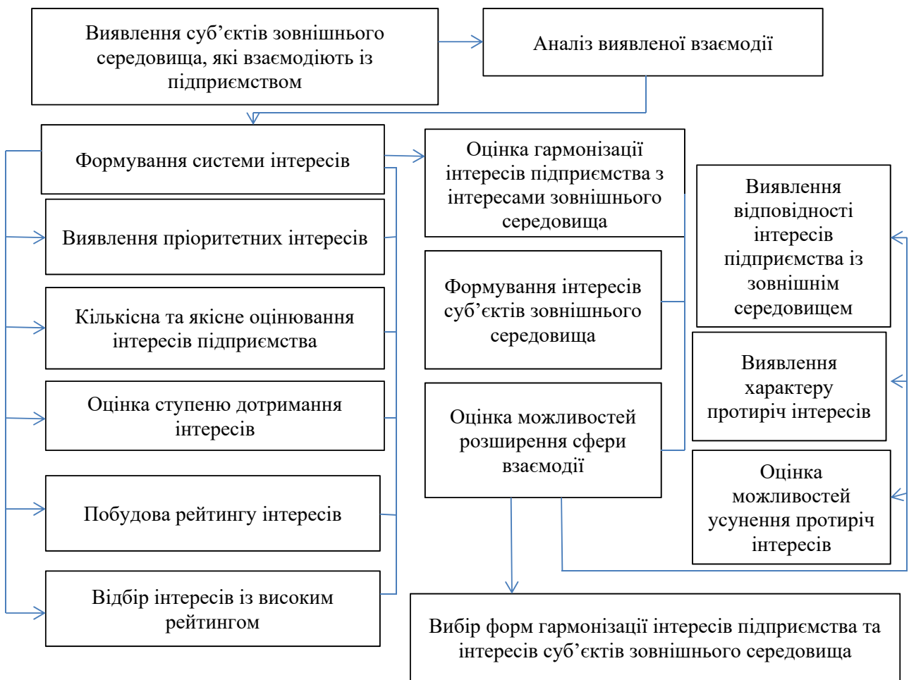
Рисунок 3 – Механізм формування системи пріоритетних інтересів підприємства

економічного розвитку на кожному з етапів життєвого циклу. Фінансово-економічні інтереси підприємства не залишаються незмінними протягом його господарської діяльності, а уточнюються на всіх етапах його життєвого циклу [5, с. 28]. Формування системи пріоритетних інтересів підприємства наведено на рис. 3. Під час формування інтересів підприємства важливо враховувати часовий аспект, тобто мають бути враховані не тільки тактичні інтереси підприємства, а й стратегічні. Пріоритетні інтереси підприємств мають бути виокремлені на основі їхнього рейтингу, що дасть змогу більш чітко сформулювати інтереси підприємства. До системи пріоритетних інтересів підприємства мають входити ті, які мають найвищий рейтинг. З метою оцінювання результатів діяльності підприємства за умови повного дотримання інтересів доцільно використовувати такі показники, які застосовують у практиці планування та обліку результатів діяльності підприємства, статистичній звітності та аналітичній роботі. Системний підхід до формування механізму оцінки стану економічної безпеки підприємства передбачає, що необхідно враховувати всі реальні умови його діяльності, а саме механізм повинен мати чітко визна-