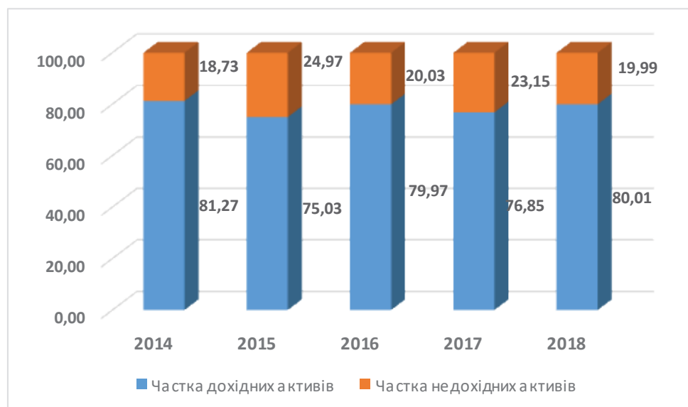
Рисунок 4 – Динаміка структури активів АТ «КредоБанк» у 2014–2018 роках у розрізі дохідності, % [6]

дитного та інвестиційного. Саме управління активами вирішує проблеми, пов'язані із прибутковістю, ліквідністю активів.