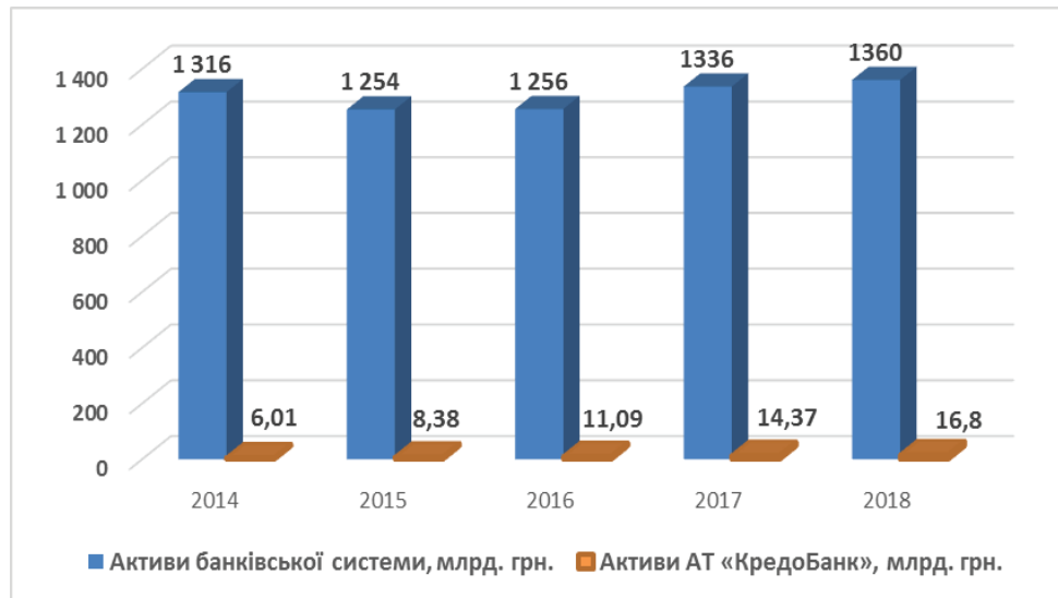
Рисунок 2 – Динаміка співвідношення активів АТ «КредоБанк» та банківської системи України за 2014–2018 рр., млрд грн. [6]

Кожен банк, як і інші підприємства й установи, працює в умовах ринку, а отже, стикається з ризиками втрат і банкрутства. Основні види ризиків пов'язані зі структурою банківського портфеля: кре-