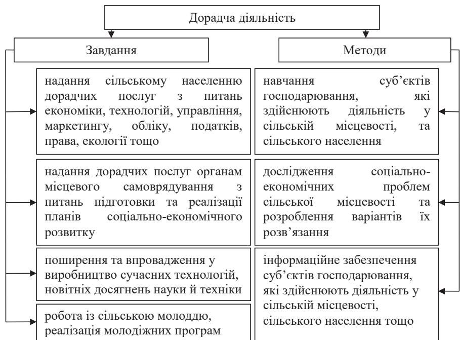
Рисунок 3 – Основні завдання та методи дорадчої діяльності