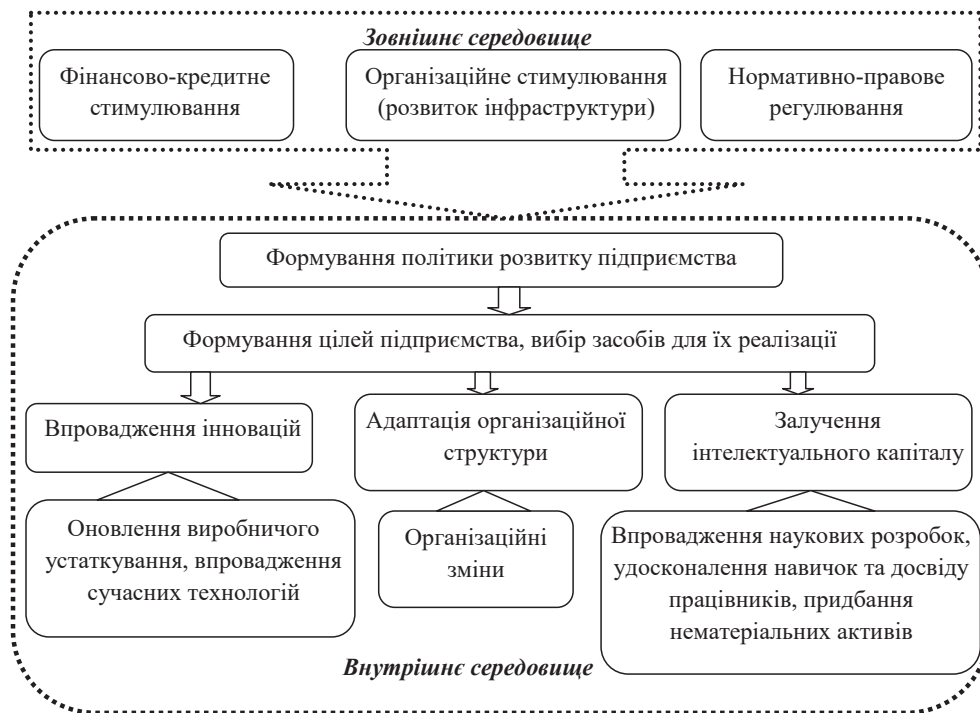
Рисунок 3 – Організаційно-економічні важелі економічного розвитку підприємств