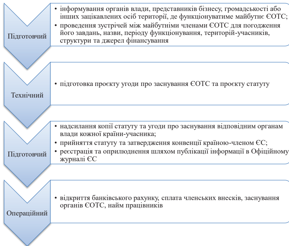
Рисунок 4 – Етапи формування ЄОТС у Європі

Вищезазначені етапи формування ЄОТС характерні для країн-членів Європейського Союзу. Для України деякі з етапів формування ЄОТС будуть залучати додаткові заходи. Наприклад, перший етап потребуватиме більш детальної інформації щодо можливостей та цілей об'єднання, представлення кращих практик ЄОТС у Європі та прогнозування перспектив їх адаптації в Україні. На третьому етапі формування ЄОТС погодження статуту та угоди в Україні, згідно з чинним