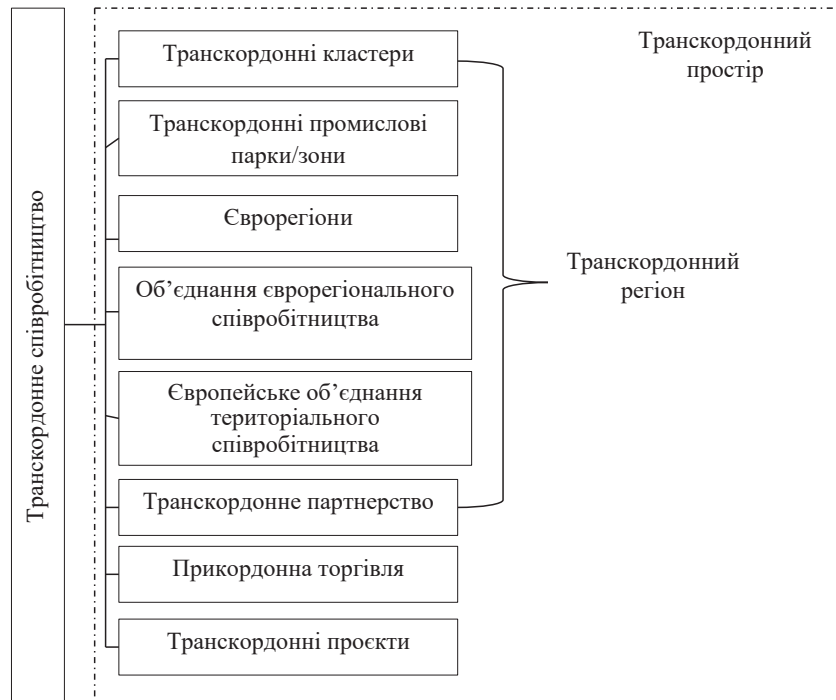
Рисунок 1 – Форми транскордонного співробітництва в Україні

Єврорегіон – це одна з організаційних форм транскордонного співробітництва, що функціонує на базі укладених двосторонніх або багатосторонніх угод про транскордонне співробітництво. Єврорегіони здійснюють свою діяльність на постійній основі, мають власні фінансові, технічні й адміністративні ресурси, мають право приймати та ухвалювати власні рішення, його географічне розташування залежить від ступеня соціально-економічної інтеграції. Єврорегіони поділяються на ті, що сформовані на прикордонних тери-