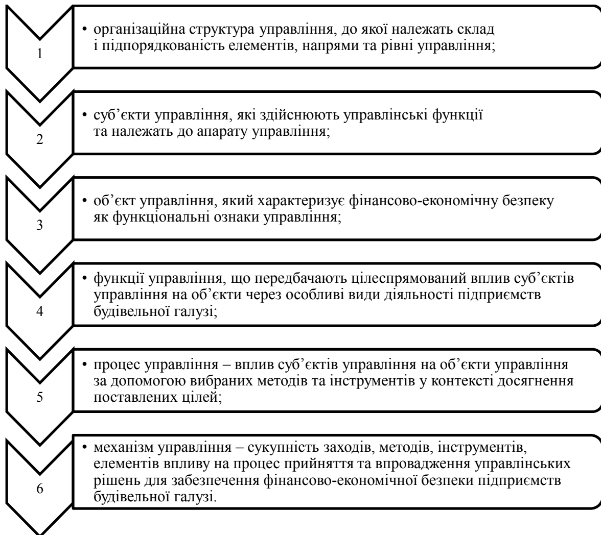
Рисунок 1 – Елементи управління фінансово-економічною безпекою підприємств будівельної галузі

Будівництво гарантує більш широке відтворення певних потужностей та основних фондів для країни. Будівельна продукція – це складова частина суспільного продукту, до якого