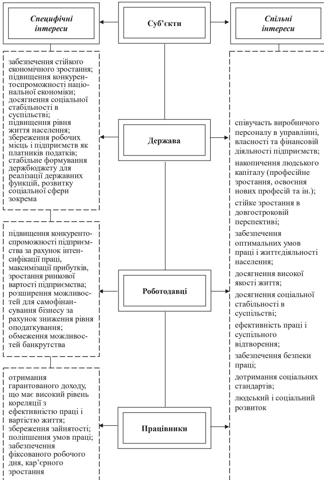
Рис. 1. Економічні інтереси основних суб'єктів ринку праці

рівня реалізації економічних інтересів суб'єктів ринку праці (держава, роботодавці, працівники) (рис. 2). Запропонована схема складається з таких блоків: суб'єкти ринку праці; економічні інтереси