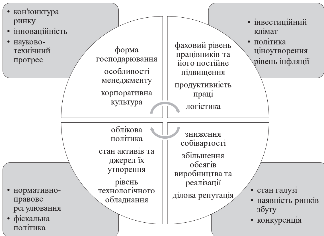
Рис. 1. Чинники впливу на прибуток

Стратегічна орієнтація системи управління прибутком визначається в розрізі перспективних орієнтирів діяльності підприємства на основі аналізу, оцінки та прогнозування стану ринкового середовища, визначення рівня одержуваного прибутку і можливостей управління ним із метою його оптимізації. Розроблення альтернативних варіантів вирішення тактичних і стратегічних завдань, а також можливість моделювання альтернативних варіантів у концепції інтегрованості управління прибутком із загальною системою