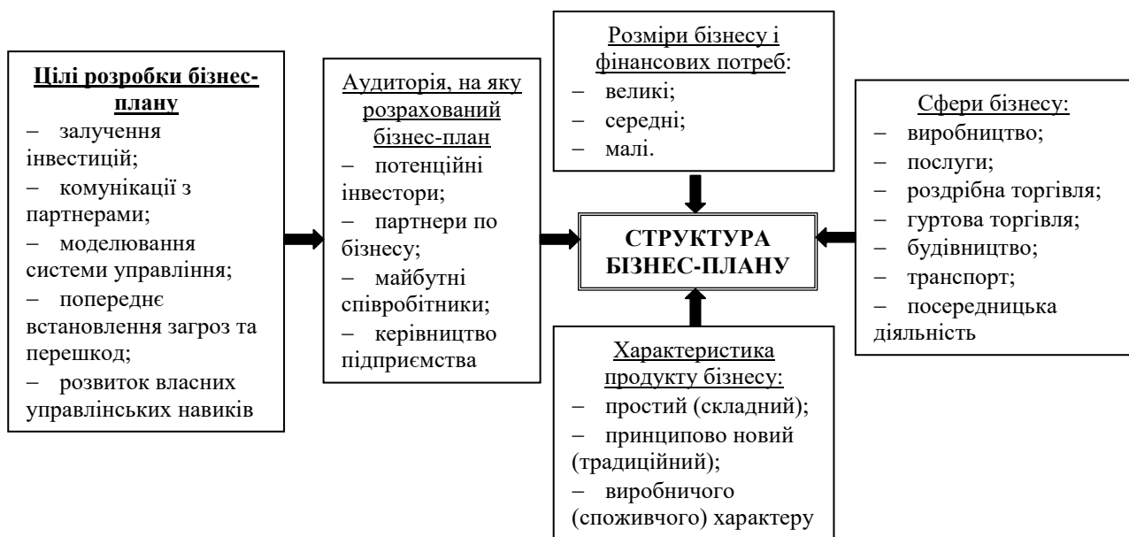
Рис. 1. Фактори впливу на зміст та структуру бізнес-плану підприємства, що реалізує стратегію конкурентоспроможності на внутрішньому ринку

завдання у забезпеченні власної конкурентоспроможності. Так, вдається пристосуватись до ринкових трансформаційних перетворень в системі ведення бізнесу, що супроводжуються зміною економічного середовища підприємства, формуванням нових методів використання ресурсного потенціалу. Тим самим, система змін формує конкурентне середовище підприємства, як сферу якісного планування процесів переходу з одного конкурентного стану в інший. При цьому бізнес-моделювання системи забезпечення конкурентоспроможності підтверджує успіх удосконалення господарсько-фінансового механізму підприємства чи започаткування нових перспективних напрямів діяльності. Саме значна кількість управлінських зв'язків, які утворюють економічні комунікації, призводить до необхідності узгодження усієї системи ведення бізнесу та збалансованості конкурентного середовища функціонування підприємств.